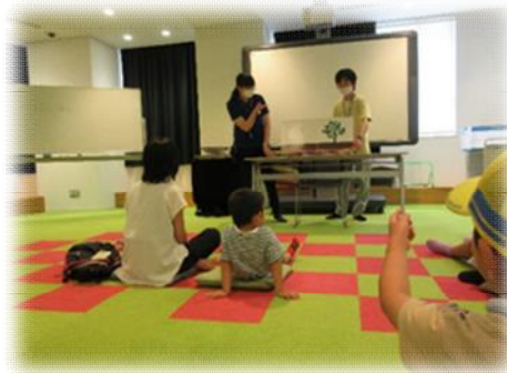
おはなし会の実践