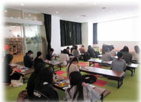
イベント用景品作り

徳島市立図書館では、ヤングアダルトボランティアを募集し、広報誌の作成、おはなし会への実践参加、大学生との交流会など、様々な活動体験を通じて図書館の使い方を学び、同世代間の交流を図りつつ、本への興味を持ち、読書へと繋がるような取組を行っています。