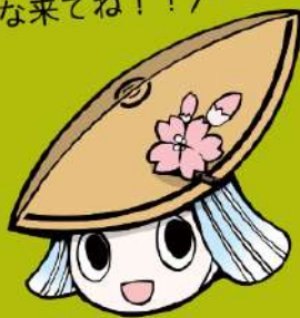
徳島市イメージアップキャラクター「トクシ」