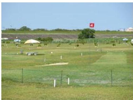
パークゴルフ場(藍住町河川敷運動公園)