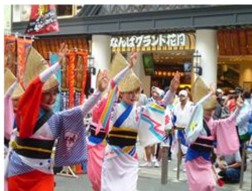
観光キャンペーン