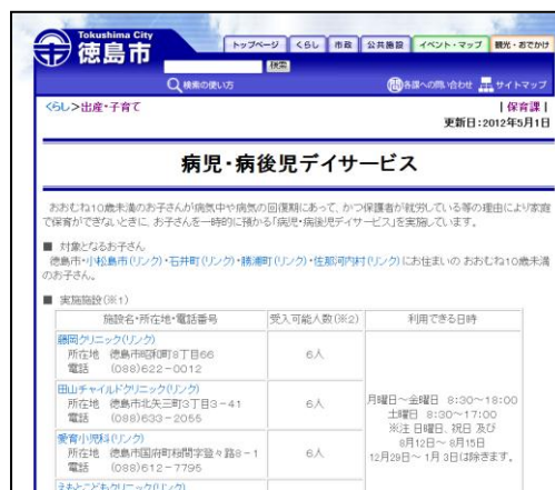
徳島市ホームページ