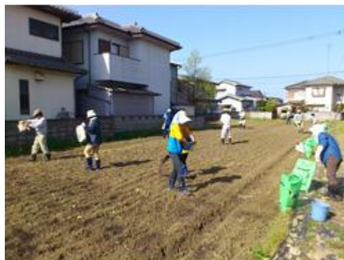
野菜栽培技術実習