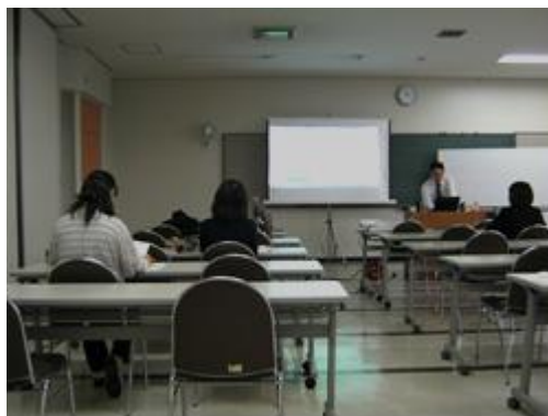
コミュニティビジネス創業セミナー

○コミュニティビジネスの起業を目指している人を対象にしたコミュニティビジネス創業セミナーを11月から12月にかけて開催（5回連続講座）