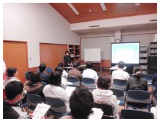
感染管理合同研修会