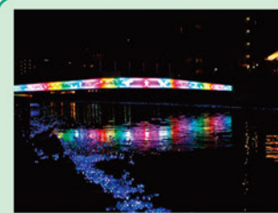
(ふれあい橋 [LEDアート]) 徳島市 人口 262,852人 面積 191.62 km 2