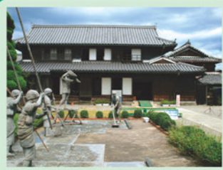
(藍の館) 藍住町 人口 33,462人 面積 16.27 km 2