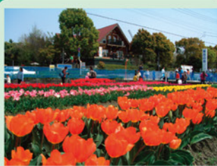
(北島チューリップ公園) 北島町 人口 22,036人 面積 8.77 km 2