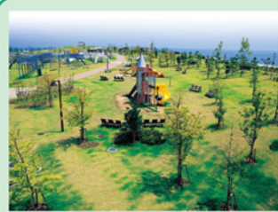
(月見ヶ丘海浜公園) 松茂町 人口 15,179人 面積 13.94 km 2