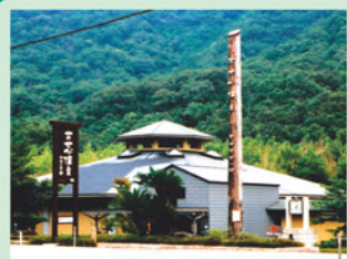
(あせび温泉) 板野町 人口 14,212人 面積 36.18 km 2