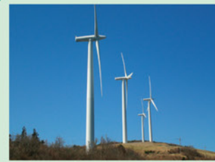
(大川原高原 [風車]) 佐那河内村 人口 2,562人 面積 42.30 km 2