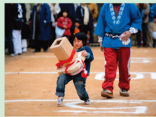
(大山寺力餅) 上板町 人口 12,929人 面積 34.51 km 2