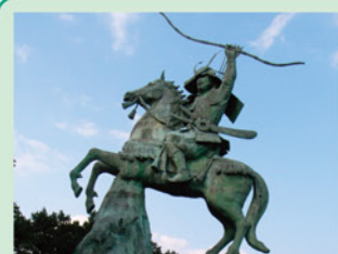
(源義経公之像) 小松島市 人口 40,305人 面積 45.30 km 2