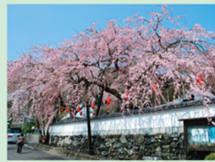
(明王寺しだれ桜) 神山町 人口 6,465人 面積 173.31 km 2