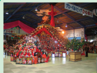
(ビッグひな祭り) 勝浦町 人口 5,952人 面積 69.80 km 2