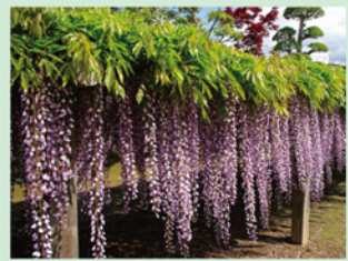
(藤 [町の花]) 石井町 人口 25,909人 面積 28.83 km 2