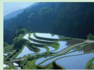
(椋原の棚田) 上勝町 人口 1,911人 面積 109.68 km 2