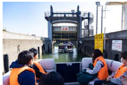
令和4年度 国交省徳島河川国道事務所と調査報告書の内容を協議 徳島河川国道事務所長をはじめ、河川整備に関わる皆様と現地視察を実施