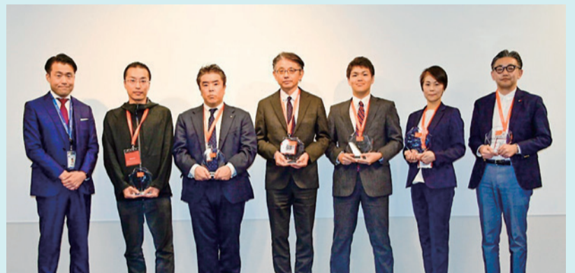
▲『Well-being CUSTOMER CENTER AWARD』の受賞の様子。株式会社AIサポートは中途採用にも力を入れていて、研修やサポート体制も充実。育休後や病気療養後など「意欲はあるけれど、どのくらい働けるか不安」という人の相談にも応じ、その人にあった働き方を提案している。