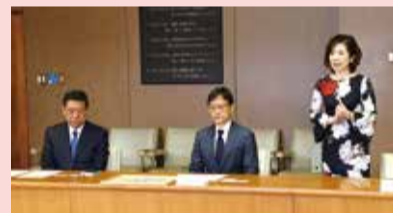
▲表彰された企業のみなさん

【株式会社フェイス】短時間正社員制度を子育て中の女性社員1人が利用しており、子育て中でもやりがいをもって仕事ができると評判がいい。また、記念日等年次有給休暇制度もあり誕生日などに利用できる。