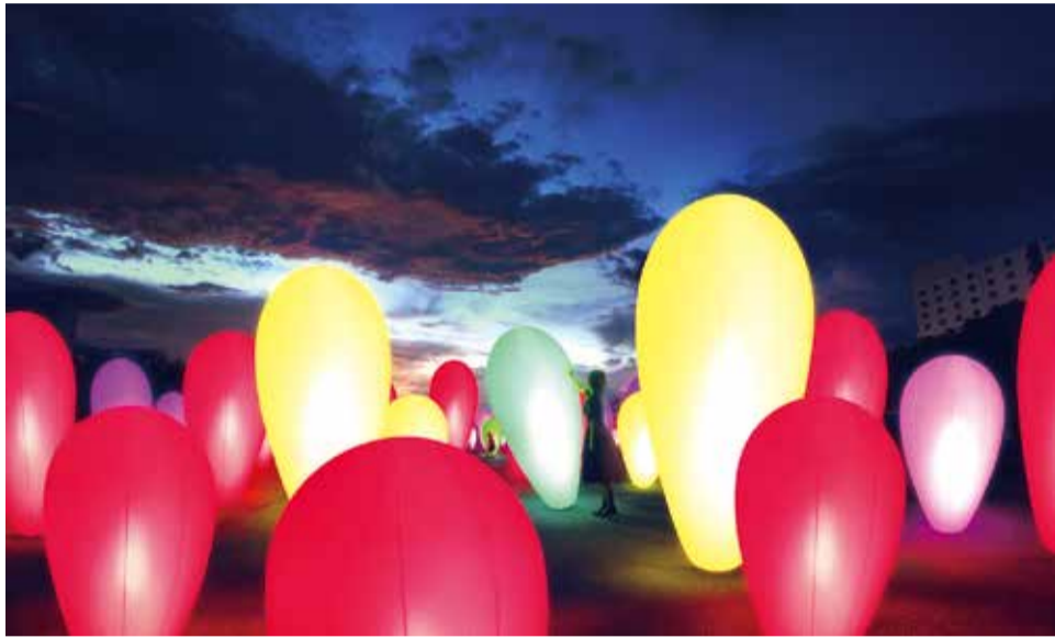
▲シンボルアート作品「自立しつとも、呼応する生命」イメージ