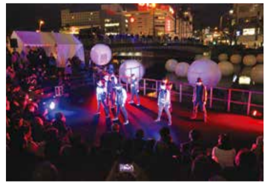
▲前回のオープニングセレモニーの様子