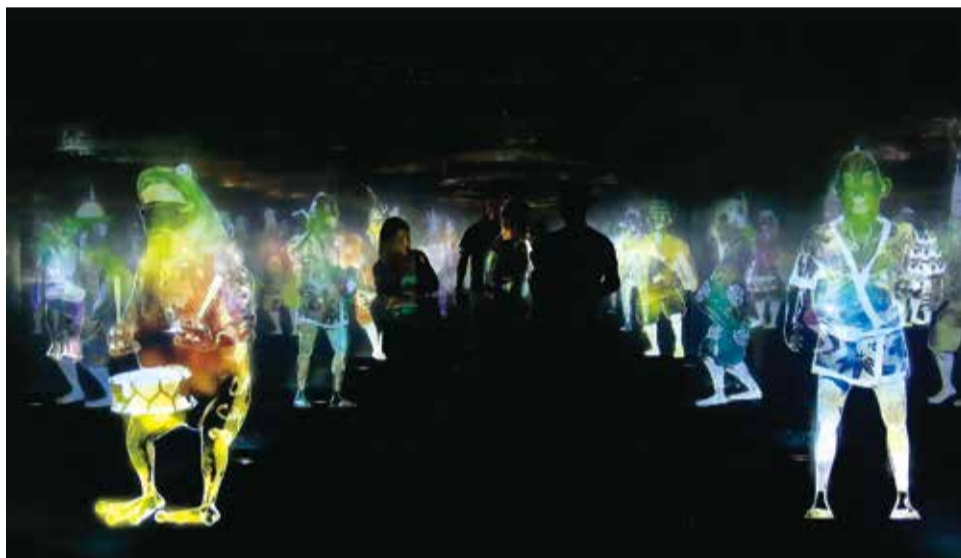
▲シンボルアート作品「秩序がなくともピースは成り立つ」イメージ