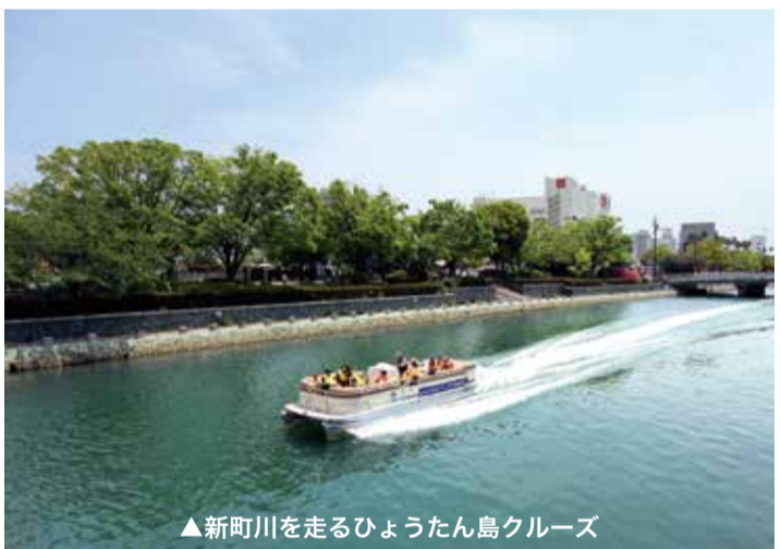
▲新町川を走るひょうたん島クルーズ

デイビッド そうですね。僕が小さい時に住んでいた街が同じ規模なんです。よ、25万人くらい。だからこれくらいの街の規模に慣れてるし、ちょうどいいんです。自然も多いからやっぱ