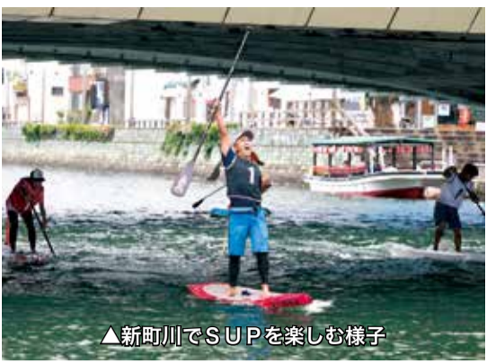
▲新町川でSUPを楽しむ様子

「さんある。あと、サーフボードの上に立ってパドルを漕いで進むスタンドアップパドルボード(SUP)が身近な川でできるのもユニーク。