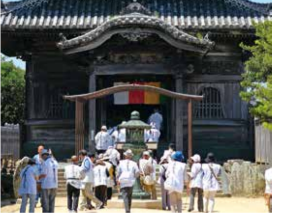
▲五か所参りを楽しむ人々