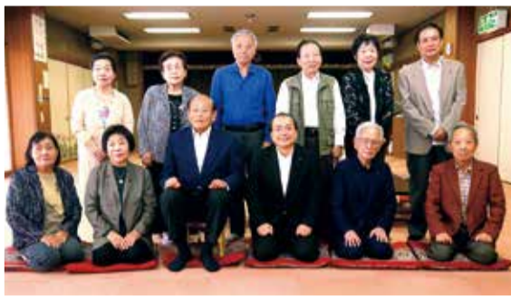
意見交換グループ