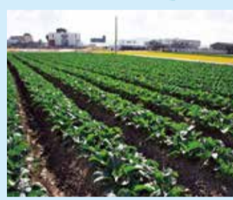
▲寒風の中、カリフラワー畑が広がる