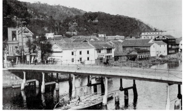
▲昭和初期の新町橋と眉山遠景

今回の展覧会では、徳島市史編さん室がこれまでに収集してきた古写真を中心に、戦災によって失われる以前の明治から昭和初期にかけての徳島市の様子がわかる資料を展示します。昔の徳島市を知る人も、まだ生まれていなかった人も、皆さん、古き良き時代の徳島市の姿をお楽しみください。