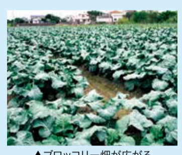
▲ブロックリー畑が広がる