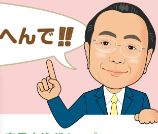
意見交換グループ