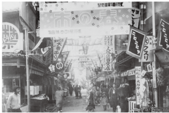
▲昭和7年の籠屋町の様子

■学芸員による展示解説 【とき】12月6日(土)、23日(祝)各日 14時～15時 ■古写真ウォーク(内町・新町地区) 【とき】平成30年1月7日(日)14時～16時