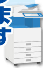
▲コンビニのマルチコピー機を操作する様子

徳島市では、10月10日(火)からマイナンバーカード(個人番号カード)を活用して、市役所の閉庁時間でも住民票の写しなどが全国のコンビニエンスストアなどで取得できる「コンビニ交付サービス」を開始します。便利なこのサービスをぜひご利用ください。また、12月28日(木)まで「マイナンバーカード普及促進キャンペーン」を実施しています。これを機会にマイナンバーカードを作ってみてはいかがでしょうか。