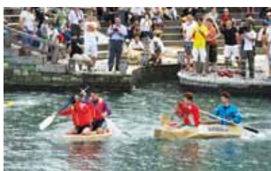
▲ダンボールボートレース