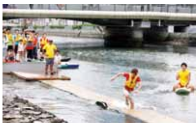
▲水上ゴザ走り選手権