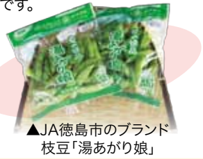
▲JA徳島市のブランド枝豆「湯あがり娘」

JA徳島市枝豆統一部会では約220人が生産しており、2月から種まきが始まり、一定期間をおいて別々の農地に8月中旬まで繰り返す。5月中旬から10月中旬まで収穫～出荷作業が続く。北・南井上地域は市内の最大生産地です。