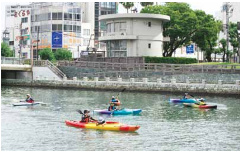
▲カヌー・カヤック体験

祭Ⅱ7月22日(金)18時〜21時 ▽花火祭Ⅱ7月23日(土)11時〜21時 ▽▽ひょうたん島音楽祭Ⅱ7月24日(日)11時〜19時30分