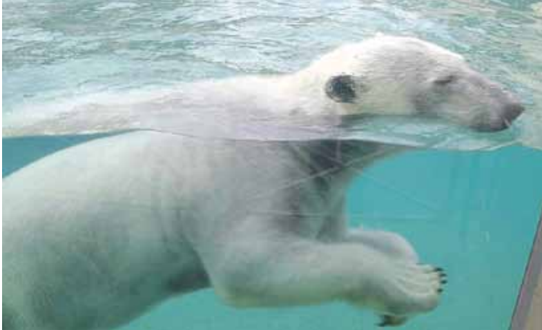
▲1年間の借り受け期間延長が決まったポロロ