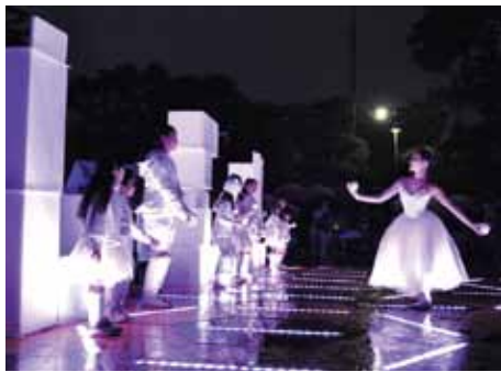
▲「徳島LEDアートフェスティバル2013」の様子

【問い合わせ先】 文化振興課 ☎(0221)5178 【申し込み方法】 はがきに、「ぐるりんツアー参加希望」と明記の上、住所、名前、電話番号を書いて、3月12日(必着)までに、徳島城博物館(〒770-0851 徳島町城内1-8 ☎656-2525)へ。