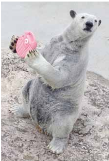
▲おもちゃで遊ぶポロロ