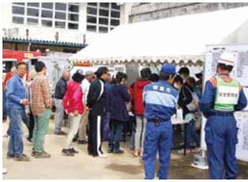
▲徳島市民総合防災訓練(川内北地区)＝昨年12月

平成23年3月11日に発生した東日本大震災でも、全国から多くのボランティアが駆け付け、救援物資の搬入、仕分けなどで活躍しました。医療や建築関係などの専門分野でも、避難所での健康管理や、道路などのインフラ復旧に大きな力を発揮しました。大きな災害時には、被災地の復興や被災者が生活を再建する上で、ボランティア活動の助けが重要となっています。