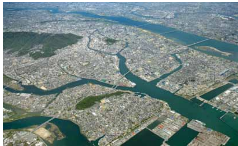
▲上空から見た徳島市

徳島市の人口(国勢調査)は、1995年をピークに減少傾向にあり、2010年には、約26万5千人となっています。 国の推計では、今後も減少傾向が続き、2040年には、約20万6千人にまで減少するとされています(左グラフ参照)。