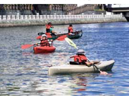
▲カヌー・カヤック体験

からまた違った水都の魅力を体感してください。 ★水上アクティビティ 【とき】7月11日(土)・12日(日) 【ところ】新町川 【内容】▼ダンボールボートレース2015(11日14時~16時) 手づくりダンボールボートで行うレース。参加者だけでなくギャラリーも楽しめます。参加費1チーム2000円。★事前申し込み必要 ▼水上ゴザ走り選手権V.O.1・2(11日・12日各日10時30分~13時30分) 川面を走るゴザ走りの大会。