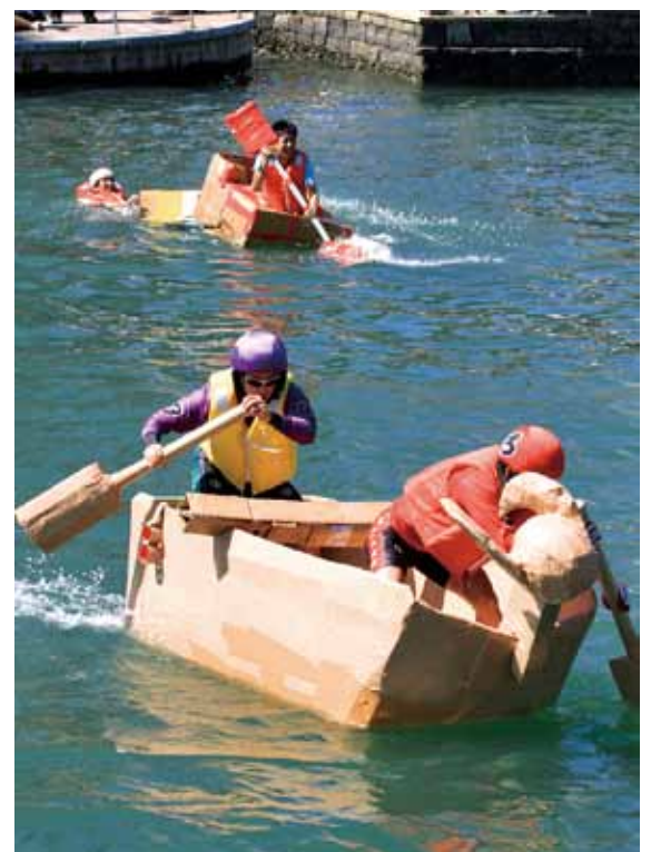
▲ダンボールボートレース

水都とくしまを体感しよう! 実際に川に入っているいろいろな体験をしていただけるイベントも用意しています。川面 ▼ナイトマルシェ(18時~21時) 川いっねーとくしまマルシェによる「ナイトマルシェ」。水際に心地よい風を感じながら買い物や食事、音楽をお楽しみください。 ▼キャンドルナイトと光の小路(19時~20時30分) 約1000個のキャンドルが水辺空間を幻想的に演出します。