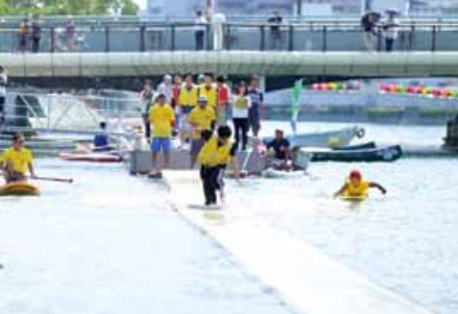
▲水上ゴザ走り選手権

水都とくしまを体感しよう! 実際に川に入っているいろいろな体験をしていただけるイベントも用意しています。川面 ▼ナイトマルシェ(18時~21時) 川いっねーとくしまマルシェによる「ナイトマルシェ」。水際に心地よい風を感じながら買い物や食事、音楽をお楽しみください。 ▼キャンドルナイトと光の小路(19時~20時30分) 約1000個のキャンドルが水辺空間を幻想的に演出します。