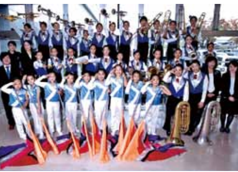
昭和小学校 brass band