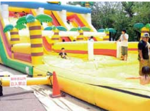
ウォータースライダー