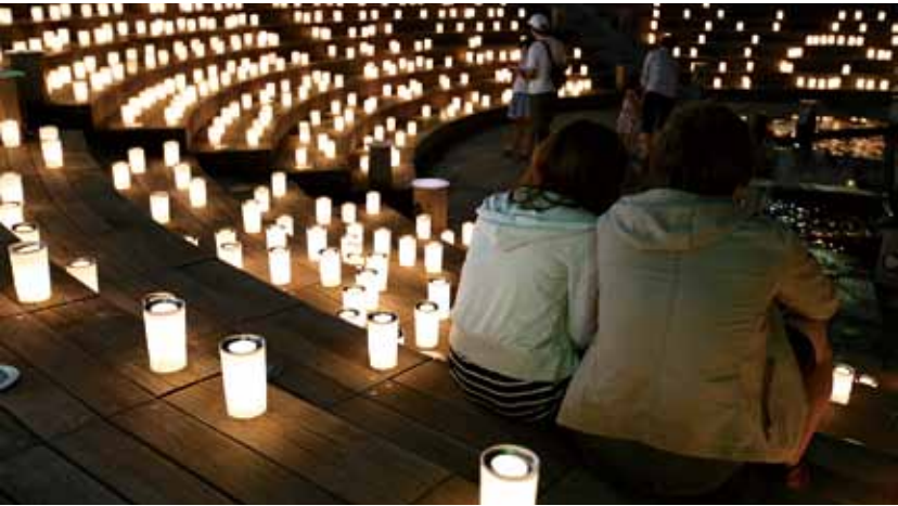
▲キャンドルナイト

広く発信することを目的としています。 水辺の魅力をこころんと楽しむお祭り このイベントは、7月10日(金)18時~21時、7月11日(土)10時~21時、7月12日(日)10時~19時に開催され、前夜祭、水上アクティビティのほか、子どもから大人までいろいろな体験ができる「ワークショップ」や徳島の食材を使った食べ物、満喫できる「とくしま食楽市」、有名アーティストたちが出演する「ステージイベント」などが行われます。