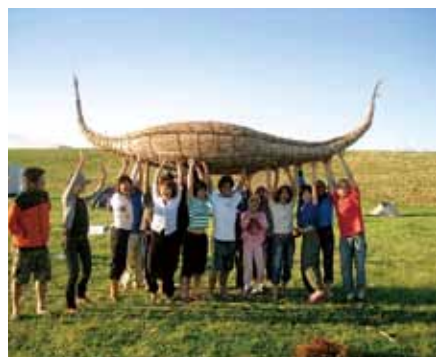
▲葦船に乗ってみよう!

からまた違った水都の魅力を体感してください。 ★水上アクティビティ 【とき】7月11日(土)・12日(日) 【ところ】新町川 【内容】▼ダンボールボートレース2015(11日14時~16時) 手づくりダンボールボートで行うレース。参加者だけでなくギャラリーも楽しめます。参加費1チーム2000円。★事前申し込み必要 ▼水上ゴザ走り選手権V.O.1・2(11日・12日各日10時30分~13時30分) 川面を走るゴザ走りの大会。