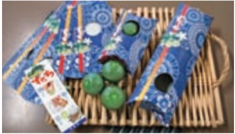
【問い合わせ先】農林水産課(☎621-5252)

お土産や結婚式、出張などですだちを贈り物として利用される市民の皆さんに、すだちパッケージ（2個詰め用・5個詰め用の2種類）を進呈していますのでご利用ください。進呈数量は1人50箱程度までです。希望者は農林水産課（市役所3階）までお越しください。なお、すだち果実は進呈対象外ですので、各自ご購入ください。