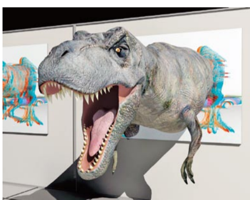
▲ティラノサウルス(3Dメガネをかけたときのイメージ写真)

とくしま動物園で、恐竜フィギュアやレプリカ、写真パネルなどを展示する恐竜展を開催します。 【内容】 ▽飛び出す3D恐竜展(ティラノサウルス・トリケラトプス・ダンクルオステウス)▽ディノニクス3Dフィギュア展 【日時】 10月22日(土)・23日(日)9時30分～16時30分(入園は16時まで) 【入園料】 大人500円(中学生以下無料) 【駐車場】 普通車310円、大型車1260円 【問い合わせ先】 とくしま動物園(636)3215、とくしまファミリーランド(636)3330