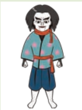
【キャラクター⑥】 木偶師匠

やんちゃな「トク」と、しっかり者の「シマ」は双子の水の精霊。徳島市らしいアイテムを身につけて、元気いっぱい。阿波おどりや人が集まるイベントが大好き。