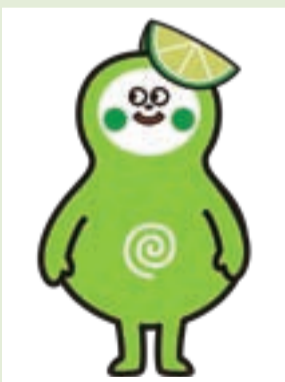
【キャラクター⑦】 ひよるりん

木偶人形をイメージしたキャラクター。顔はこわくても、心は優しく楽しい、そのギャップが魅力。市の花「サクラ」の模様が入った藍染めの衣装を着て、フットワークが良い。