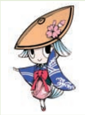
【キャラクター②】 とくしーちゃん

市を流れる138の川に住みついているワニたち。「しんまちがわーにー」にはLEDをあしらうなど、住んでいる川に合わせてさまざまな特徴があります。