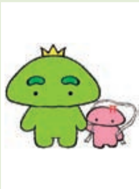
【キャラクター④】 眉さん(山)と 弁天さん(山)

阿波おどりと釣りが得意な犬のキャラクター。毛の色は清流をイメージした青と白、体の模様は川の流れを表しています。いつも朗らかで楽しいことが大好き。