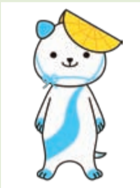
【キャラクター③】 あわわん

水とともに発展してきたまちをイメージした魚の女の子。振り袖の阿波おどりの衣装に、市の花「サクラ」の花飾りをつけています。明るく楽しく、どこでも踊ります。