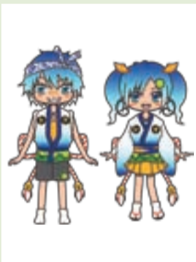
【キャラクター⑤】 水眉トク、シマ

市のシンボル眉山と日本一低い弁天山をイメージしたキャラクター。「眉さん」は王冠と太い眉、桜色の「弁天さん」は鳥居の髪飾りと羽衣がポイント。