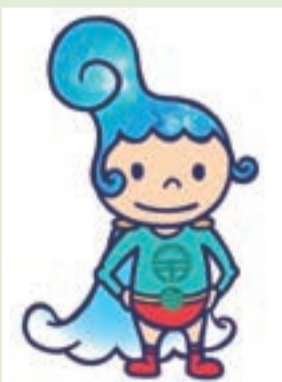
【キャラクター⑧】 トクシマン

ひょうたん島が立ち上がったイメージのキャラクター。スタチの笠をかぶり、特技は阿波おどり。人形浄瑠璃の木偶人形のように表情が変わって個性的です。