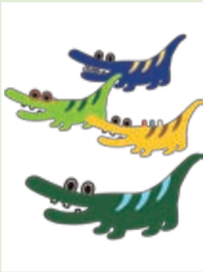
【キャラクター①】 カワニー(ズ) K "AWA" NIES

市を流れる138の川に住みついているワニたち。「しんまちがわーにー」にはLEDをあしらうなど、住んでいる川に合わせてさまざまな特徴があります。