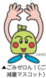
▲ごみゼロん!(ごみ減量マスコット)