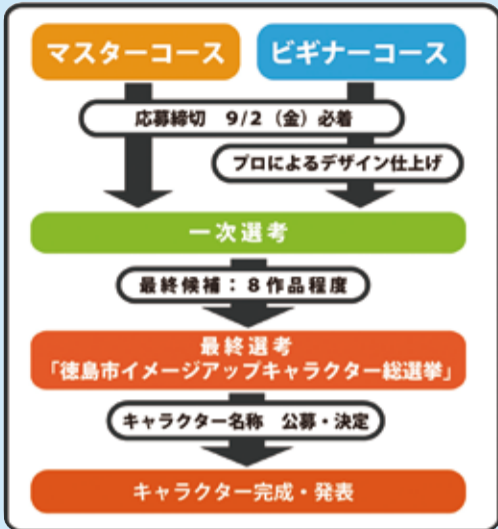
▲募集・選考の流れ

[応募方法] 募集要項(市役所1階案内や各支所で配布、市ホームページからもダウンロード可)をご確認の上、応募用紙に必要事項を記入し、デザイン画などを添えて、直接または郵送で、企画政策課(〒770-8571 幸町2-5 市役所8階)へ。市ホームページ上の応募フォームからも応募可。