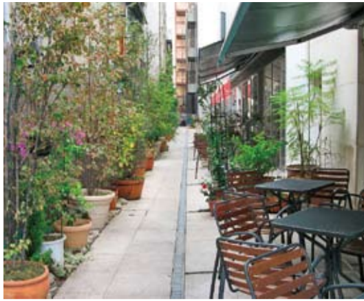
▲第12回街づくりデザイン賞「蘇る路地裏賞」【MEITEN-GAI】(徳島駅前名店街)

徳島市では、都市の美化や都市景観の向上に貢献している優れた建築物などを顕彰する第13回徳島市「街づくりデザイン賞」を次のとおり実施します。皆さんの周りにおける魅力的な建築物などを推薦してください。