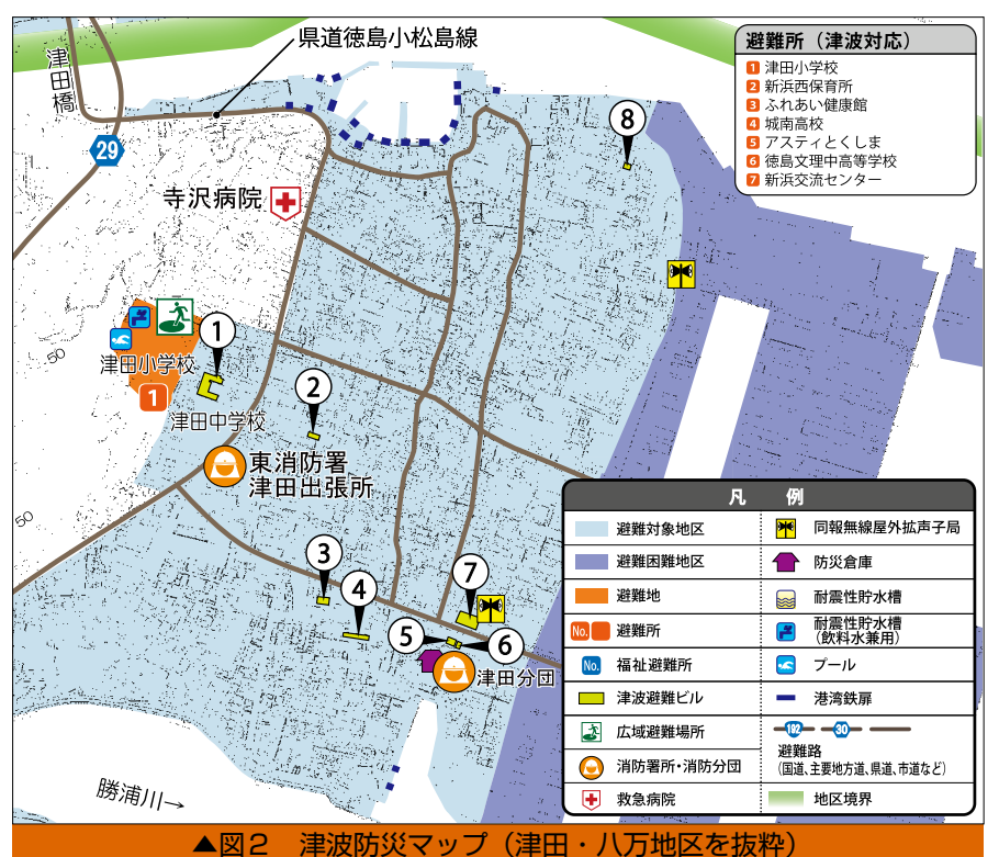
▲図2 津波防災マップ(津田・八万地区を抜粋)

結果から、津波発生時の避難対象地区や避難所、津波避難ビル、防災施設などを地図上に表しています(図2参照)。