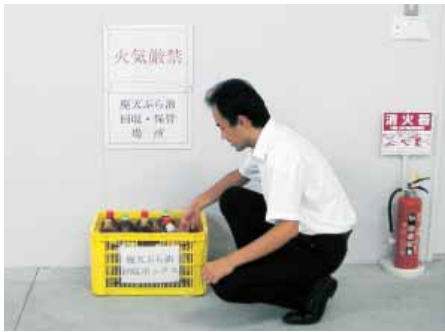
▲昨年度選定された取り組み=ボックスを設置して社員から廃食用油を回収し、バイオ燃料として再生(松本コンサルタント)

省エネルギー・省資源など、環境対策に積極的に取り組まれている事業者の皆さんからの応募をお待ちしています。