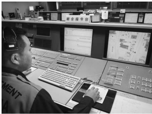
▶位置情報通知システムにより発信位置を表示