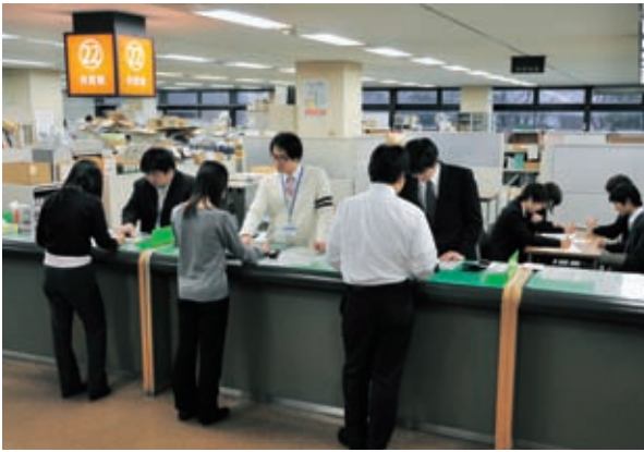
▲申告をお忘れなく！(市役所2階22番窓口市民税課申告会場)