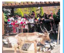
▲昨年のクリスマスの様子