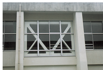
補強後の屋内運動場外観

その結果、耐震性が低いと判定された建物に対して、平成18年度から耐震補強計画・評価判定・実施設計を行い、順次、耐