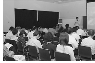
▲公開プレゼンの様子=市役所

▼「家具転倒防止ポランテ イア育成・派遣事業」(NP O法人・阿波グローカルネ ット) 家具転倒防止の有 効性を啓発するとともに、 ポランテアを育成し、自 助で実施困難な高齢者や障 害者世帯に對して派遣者や障 害者で対応できない高年齢者 ▼「ひょうたん島・景観ま ちづくり事業」NP O法人 新町川を守る会と(徳島県 建築士会徳島支部) 〓ひよ うたん島の新たな魅力づく りや景観保全を考へる ▼「かがやき徳島スポーツ 交流フォーラム」NP O法 人スペシャルオリンピッ クス日本・徳島) 〓ポラン テアや社会貢献活動をした い個人・企業が知的障害や