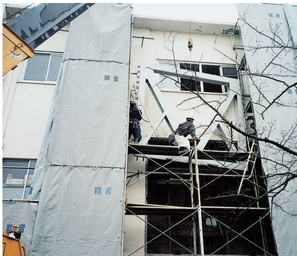
鉄骨枠付きブレース増設補強を行う校舎(佐古小学校/平成18年12月)