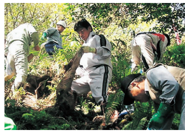
▲市民と一緒に眉山の清掃をする市長=17年4月

ツなど非常に幅広い分野で提案がされています。こうした制度をきっかけにして、協働の意識を広げていければと思います。「協働」という考え方は、市民のニーズの多様化や参画意識の高まりなどを背景に、ここ数年、急速に浸透してきています。今後の行政運営を考えると、協働は必要不可欠です。また、協働を進める中で、市民の皆さんの柔軟な発想に行政が刺激されることもあるでしょう。こうした循環も大切だと思います。また、「自分たちのまちは自分たちでつくる」という意識の高いところほど、地方分権時代に生き残れる