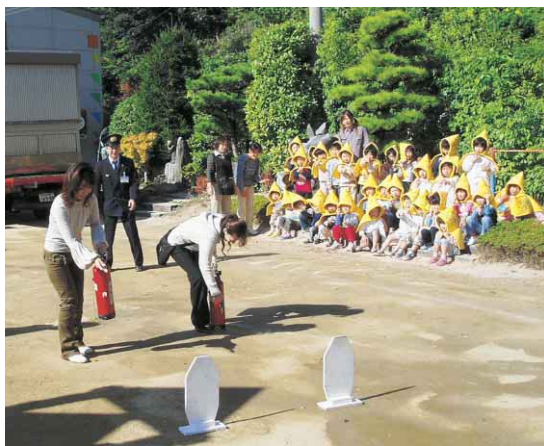
火災予防には一人一人の意識が大切です。

「マイシティとくしま」(四国放送テレビ) 毎週日曜日 11:50~正午放送 「徳島市NOW」(ケーブルテレビ徳島) 毎日3回週替わりで放送