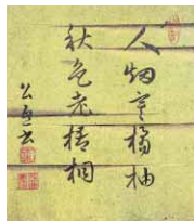
蜂須賀重喜筆・色紙

徳島城博物館では、日本の書の魅力を、コレクターの眼差しを通して紹介する企画展「書の美を愛でる」を開催中です。