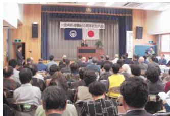
一宮城跡保勝会50周年記念大会の風景

十分には立ち直っていない時代でしたが、町には歴史研究家も多く、一宮城跡を県の文化財史跡として申請すると同時に、この城山を中心に、観光・文化・産業の発展と振興を図ろうと、地元有志5人が発起人となり35人でスタートしました。当初はまず城山の修復を、昭和30年代から登山道改修や城跡の俯瞰図設置などを。40年代には周辺山頂の遺構に展望台を建設したり、桜を植樹したり。恒例化した本丸跡で初日の出を見る新年行事もこのころから。61年には本丸の石垣修復を終え、平成3年に公民館で阿波一宮城シンポジウムを開催し、阿波一宮城資料集を発行しました。毎年欠かさず行う年3回の城跡清掃にも多くの住民が参加するよう、ひとにかく何かを