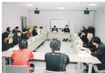
活発な意見交換が行われた第2回の熱々トーク

「まちづくりとスポーツ」をテーマにした第2回わがまちミーティングが、市長と一緒に熱々トークが、11月25日、ふれあい健康館で開催されました。