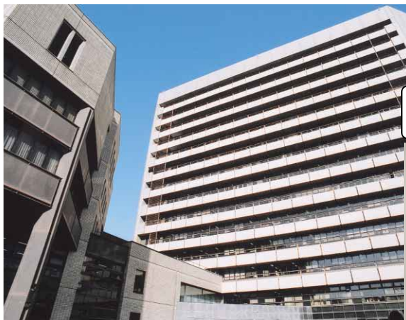
市役所本庁舎の組織が行う活動が登録範囲になります。

●徳島市の広報番組 「マイシティとくしま」(四国放送テレビ) 毎週日曜日 11:50~正午放送 「こんにちは徳島市です」(ケーブルテレビ徳島) 毎日4回週替わりで放送