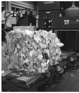
選別後、圧縮されたプラスチック製容器包装ごみ

収集したごみの中に、プラスチック製容器包装ごみ以外の燃やせないごみや刃物などが入り込んでいます。また、ガスが残っているライターや刃物などが入り込んでいます。