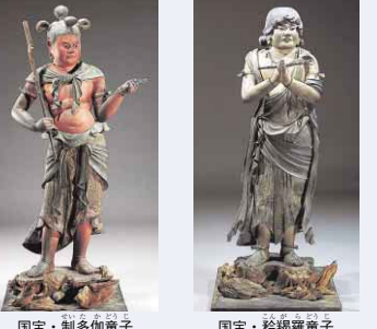
国宝・制多伽童子 国宝・矜羯羅童子

【問い合わせ先】 ◆徳島城博物館 ☎(656) 2525 (火～日曜日 9:30～17:00) ◆徳島新聞社事業部内「聖地高野山と四国の空と海」展実行委員会 ☎(655) 7331 (平日 9:30～17:30)