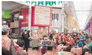
人に優しいまちづくりをテーマに東新町で歌う会を開催—昨年=

「徳島・ふれ愛まぢづくり」研究会で研究したいテーマを持つ市民グループを募集します。 同学会は、市民の皆さんが主体となり、さまざまな分野での市民活動のあり方や、行政との協働について