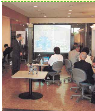
大型スクリーンとパソコンを使い生涯学習

徳島市は徳島大学と共同で、シビックIT実践学習センターを開設しました。同大学教員が指導をする、より高度で実践的なIT講座などを開催し、習得したIT技術で社会貢献できる人材の育成を目指します。 市では昭和58年のシビックセンター開設以来、市民の皆さんを対象に、情報化社会に適合するためのパソコン指導や無料インターネット体験など、基礎的な取り組みを行ってきました。今後は大学のさまざまな情報や人材、ノウハウなどの提供を受けながら、パソコンの活用方法に主眼を置き、個人相談に応じるIT相談(要予約)も実施するなど、ITを使いこなす実