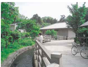
400年前の農業用水を利用し、整備したせせらぎロード

平成6年、その丈六寺周辺の農業用水を利用し、徳島市が「せせらぎロード」を整備しました。以来「新旧住民共通の憩いの場になり、皆でまちづくりを」との新しい気運も生まれました。と、丈六町と洪野町を統括する多家良コミュニティ