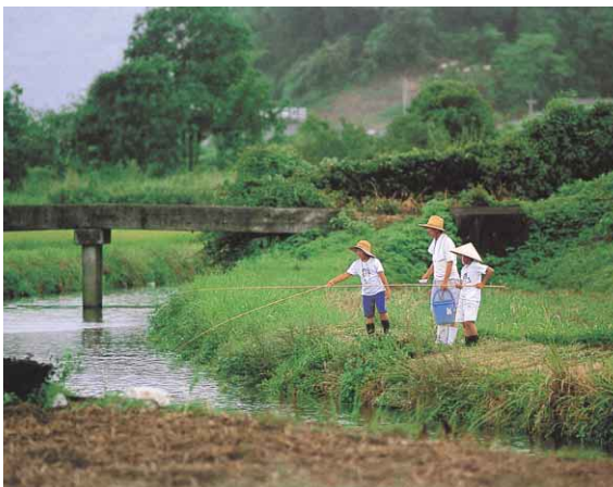
恵まれた自然を後世に残すため、できることから実践してみませんか

●徳島市の広報番組 「マイシティとくしま」(四国放送テレビ) 毎週日曜日 11:50~正午放送 「こんにちは徳島市です」(ケーブルテレビ徳島) 毎日4回交替わりて放送