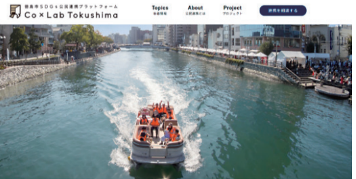
▲特設ウェブサイト「Co×Lab Tokushima」トップページ