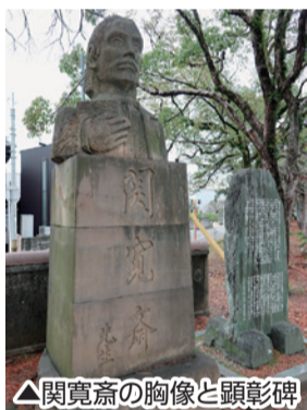
△関寛齋の胸像と顕彰碑

助任川沿いの中徳島河畔緑地(徳島町)に、徳島藩医、町の開業医として活躍した関寛齋(1830～1912年)の胸像と顕彰碑があります。