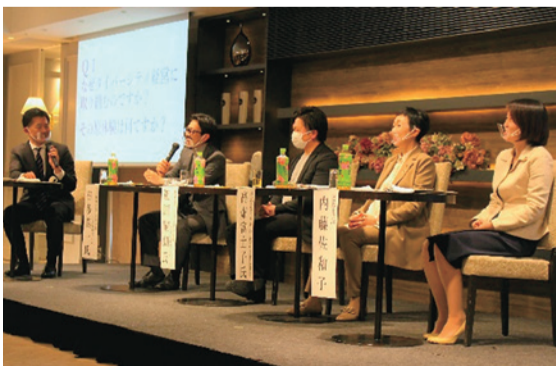
▲パネルディスカッションの様子

[問い合わせ先] 男女共同参画センター(☎624-2611 FAX624-2612)