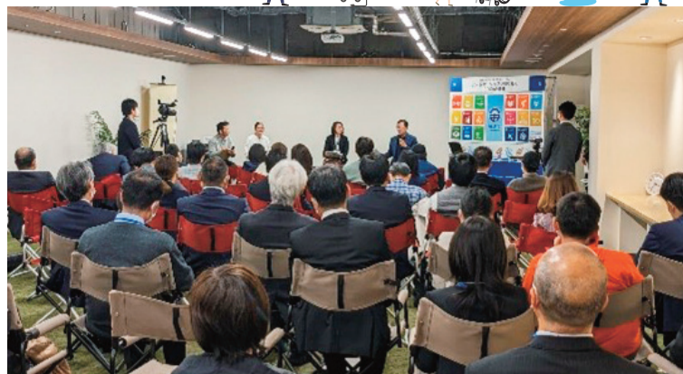
▲SDGs未来都市フォーラムの様子