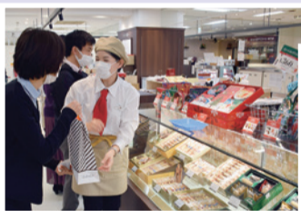
▲買い物客でにぎわうアミコビルの店舗