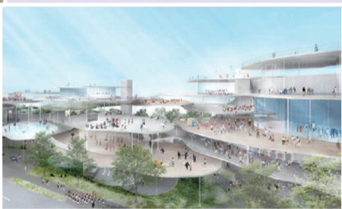
▼新ホール外観イメージ