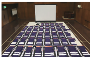
▲婦人防火クラブ活動資機材 (法被・防火広報用視聴覚資材)

財団法人自治総合センターは、宝くじの受託事業収入を財源に、コミュニティ組織などの活動を助成する社会貢献広報事業を実施しています。本市では、この事業により、令和3年度に婦人防火クラブ、幼年消防クラブおよび少年消防クラブへの活動資機材(下写真)を整備しました。