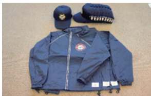
▲少年消防クラブ活動資機材 (帽子・ウインドブレーカー)