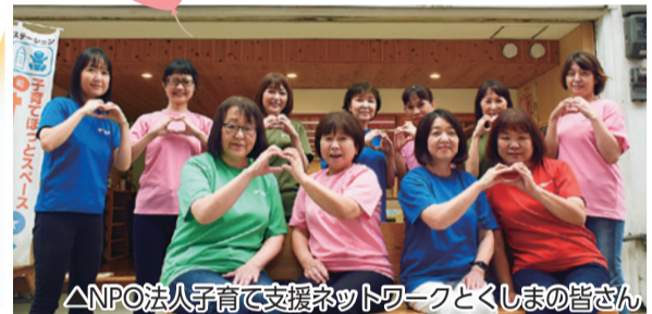
△NPO法人子育て支援ネットワークとくしまの皆さん

徳島市では「協働による新たなまちづくり事業」として、まちの社会的課題を解決するために活動する団体を支援しています。このたび、事業に必要な資金をクラウドファンディングで募集しますので、皆様のご支援をお願いします。