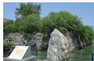
▲徳島城跡(月見櫓跡)