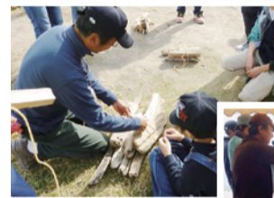
▲▲防災デイキャンプの様子