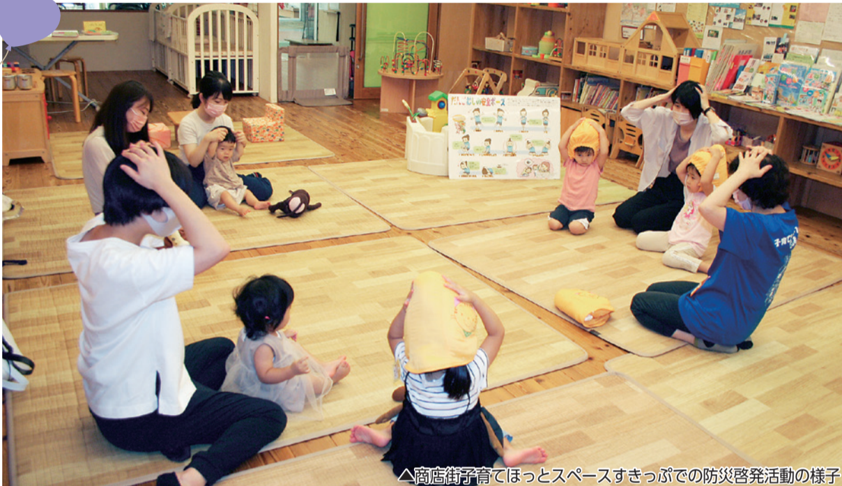
△商店街子育てほっとスペースすきっぷでの防災啓発活動の様子