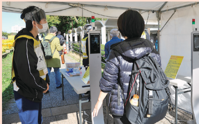
▲入場口では検温や手指消毒などを実施