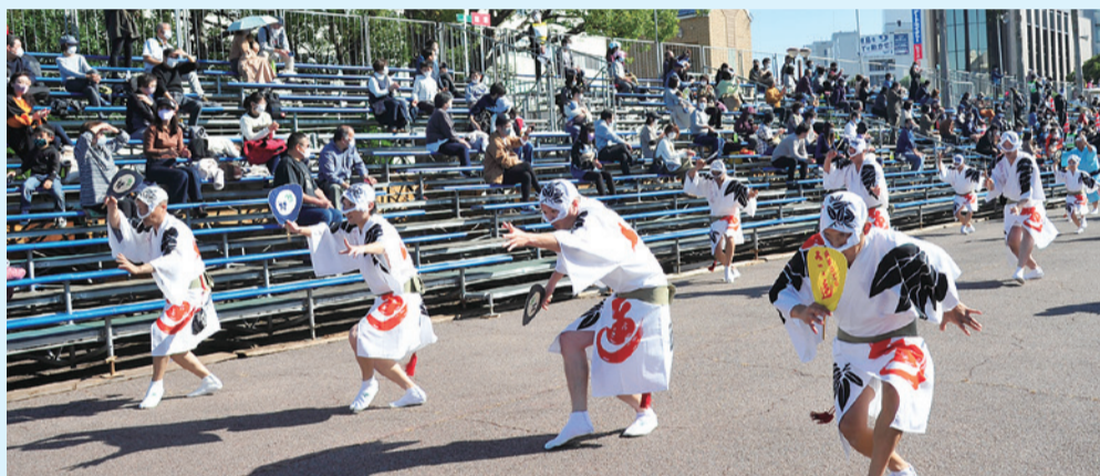
▲観客と踊り手の距離を十分に確保

11月21日・22日の2日間、阿波おどり実行委員会が県・市と共催で、WITH・コロナ時代における安心・安全な阿波おどりの開催方法を検証するため、「阿波おどりネクストモデル」を実施しました。本イベントはさまざまな感染防止対策を講じており、そこで得られた検証結果を2021年阿波おどり事業計画に反映していきます。