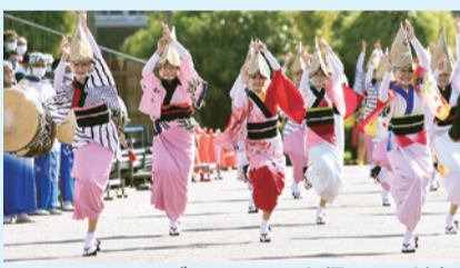
▲ソーシャルディスタンスを保っての演舞