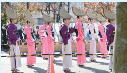
▲待機スペースで待つ踊り手