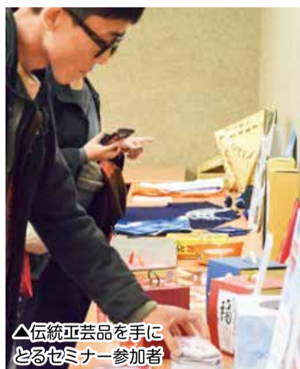
△伝統工芸品を手にとるセミナー参加者