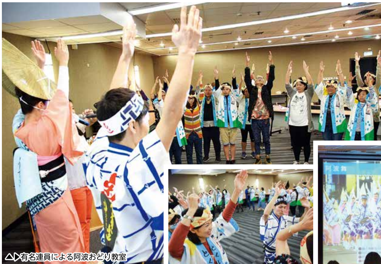
△有名連員による阿波おどり教室