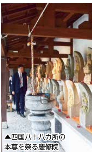
▲四国八十八カ所の本尊を祭る慶修院