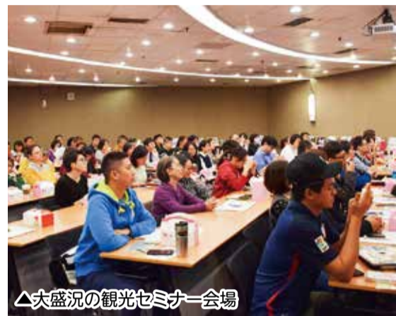
△大盛況の観光セミナー会場