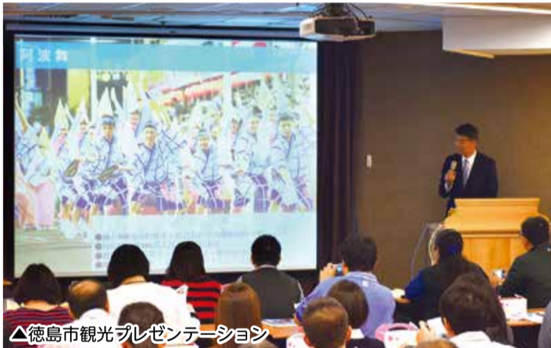
△徳島市観光プレゼンテーション