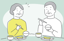
食事会 一人で食べるより 楽しく食事がしたいな…