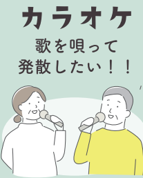
カラオケ 歌を唄って 発散したい！！