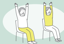
体操 みんなでやると 続けられるかも…

運営の仲間が出来たら、次に「集いの場」をどのようなものにしていくかをみんなで話し合ってください。また、決めたものであっても、必要に応じて柔軟に見直していくことが大切です。その柔軟性が、住民活動ならではの特性であり、活動を継続していく秘訣でもあります。