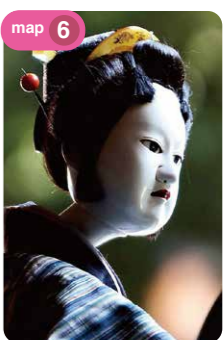
木偶淨琉璃戲的木偶