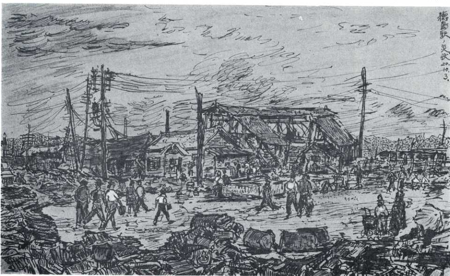
昭和20年7月4日の空襲で焼けた徳島駅の災状 昭和20年10月3日 多田義夫スケッチ