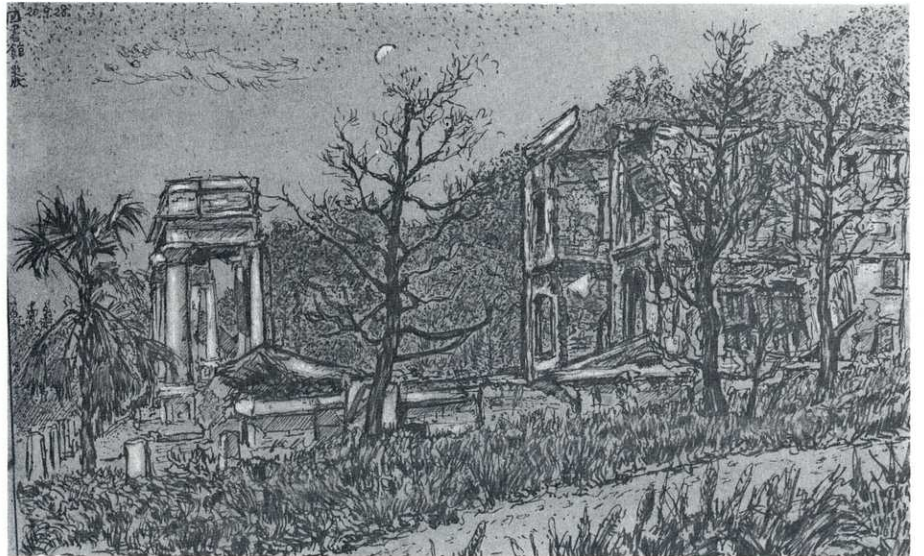
昭和20年7月4日の空襲で焼けおちた徳島公園内の光慶図書館 昭和20年9月28日 多田義夫スケッチ