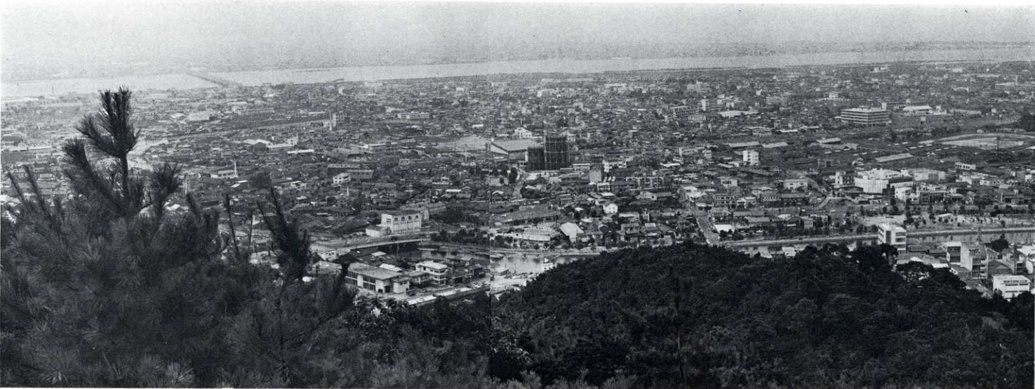
戦災24年後復興なった市街(1) 昭和44年(1969)7月撮影

なおこの空襲後も艦載機による機銃掃射が連日反復して行なわれ、8月15日の終戦まで続いた。