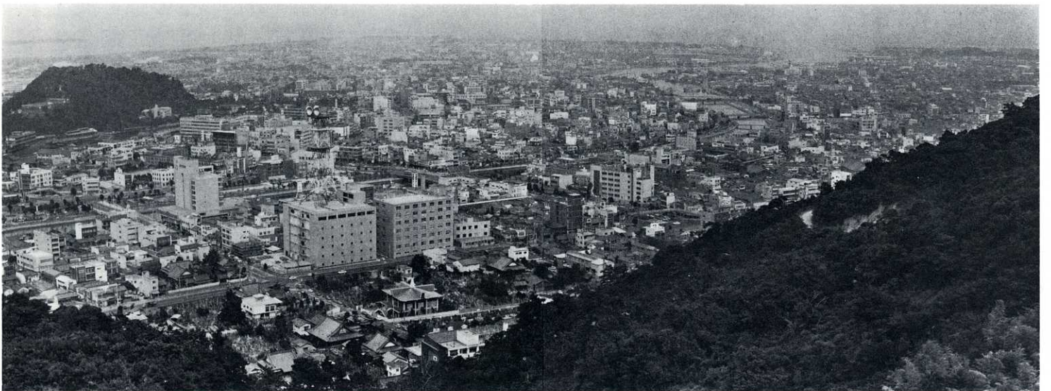
戦災24年後復興なった市街(2) 昭和44年(1969)7月撮影