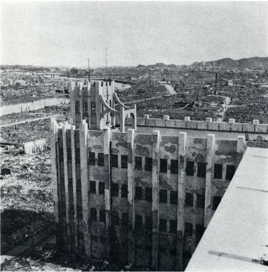
市街中心部の災状 中央は一楽屋百貨店