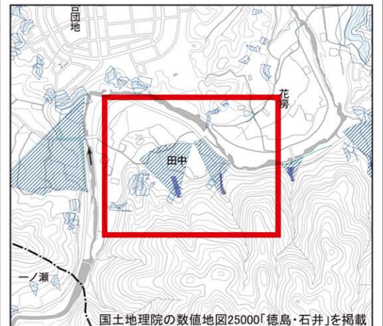
国土地理院の数値地図25000「徳島・石井」を掲載 位置図 (1/25,000)

(※)平成26年から30年の台風時に徳島市が確認した道路冠水箇所と地元消防団が大雨時に確認した道路冠水箇所を記載しています。降雨の状況によっては、他の場所も冠水するおそれがありますので注意してください。